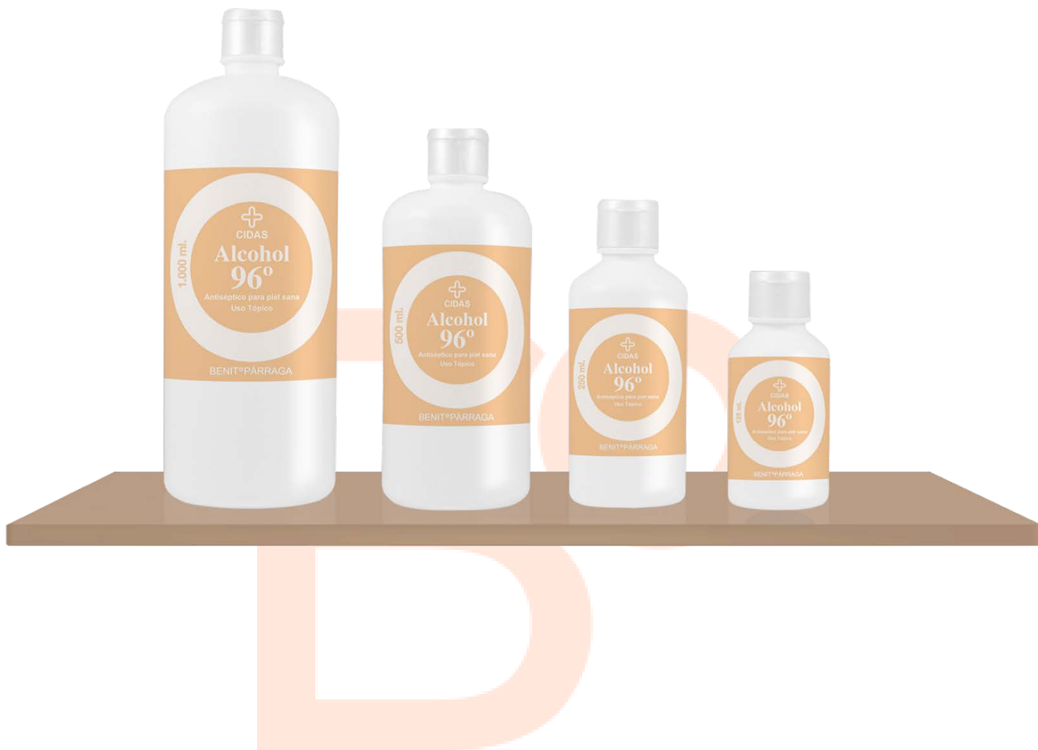
IMAGEN DEL FORMULADO