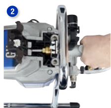
Extraiga la sección de la bomba