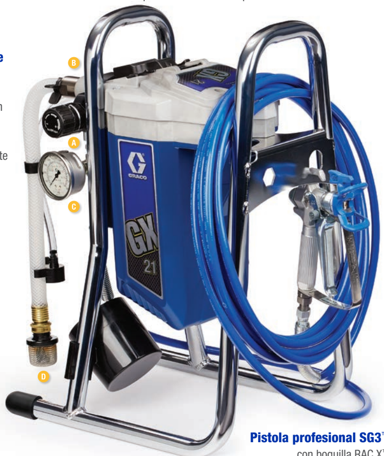
Pistola profesional SG3™ con boquilla RAC X™ y manguera de 15 m.