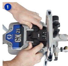
Deslice y levante la tapa de acceso para abrirla