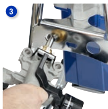
Utilice el racor hexagonal del bastidor para aflojar la bomba y extraer el cartucho