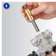
Instale el nuevo cartucho y sustituya la bomba