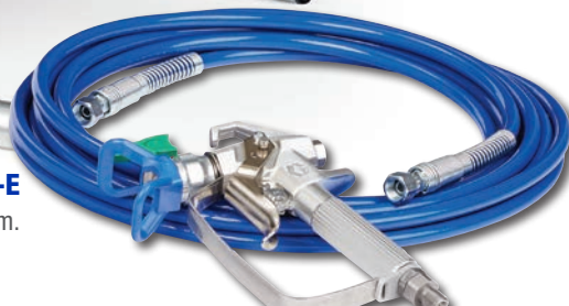
Pistola profesional FTx™ -E con boquilla RAC X™ y manguera de 7,5 m.

El kit incluye: bastidor de rodillo desmontable ligero, extensión de 50 cm, válvula CleanShot™ Shut-Off™, pistola InLine™, boquilla de pulverización y portaboquillas